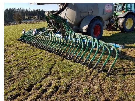
Schleppschuh: Bodenausbringung unter der Vegetation ohne den Boden zu beschädigen, reduzierte Verflüchtigung