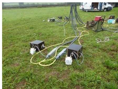
Photo des Versuchsaufbaus