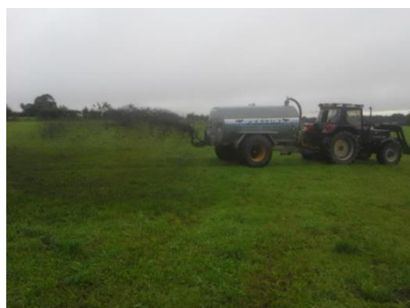
Schwenkverfahren: oberflächliche Ausbringung in großen Tropfen für einer geringere Verflüchtigung