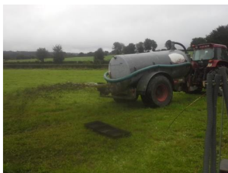
Prallteller: viel Kontakt zwischen Luft und Gülle, was die Verflüchtigung begünstigt